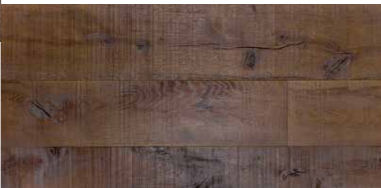
TAVOLA IN 3 STRATI | BOARD 3 LAYERS 18 mm

Lavorazione contorta, verniciato Processing twisted, varnish