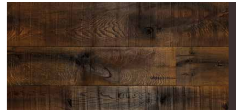
TAVOLA IN 3 STRATI | BOARD 3 LAYERS 18 mm

Lavorazione contorta, verniciato Processing twisted, varnish