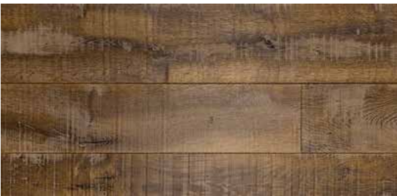
TAVOLA IN 3 STRATI | BOARD 3 LAYERS

Lavorazione contorta, verniciato Processing twisted, varnish