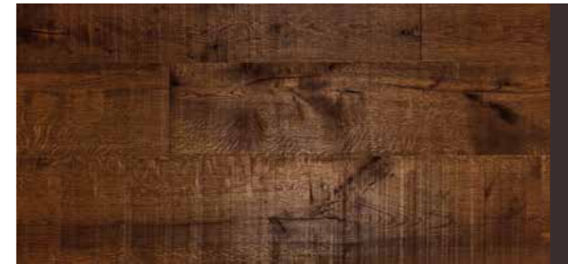
TAVOLA IN 3 STRATI | BOARD 3 LAYERS 18 mm

Lavorazione contorta, verniciato Processing twisted, varnish