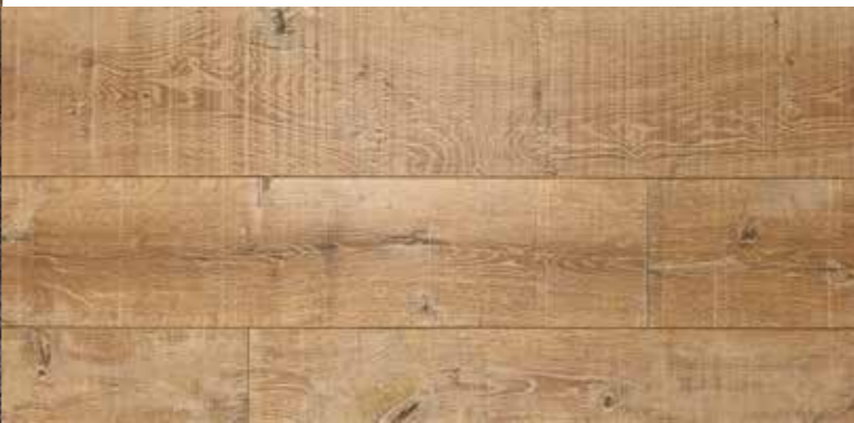
TAVOLA IN 3 STRATI | BOARD 3 LAYERS 18 mm

Lavorazione contorta, verniciato Processing twisted, varnish